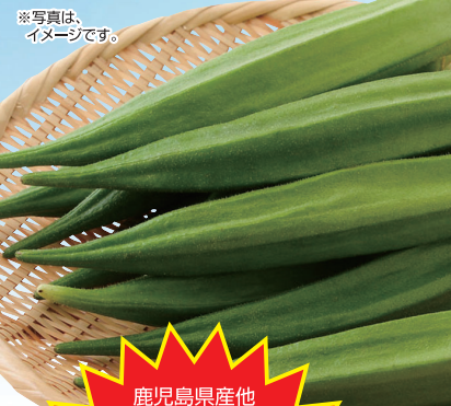
※写真は、イメージです。