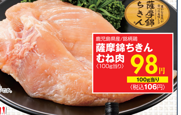
※写真は、イメージです。

鹿児島県産/銘柄鶏 薩摩錦ちきん むね肉 (100g当り) 98円 100g当り (税込106円)