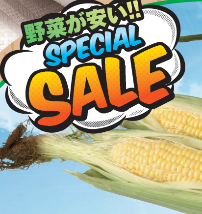
※写真は、イメージです。

鹿児島県産/銘柄鶏 薩摩錦ちきん むね肉 (100g当り) 98円 100g当り (税込106円)