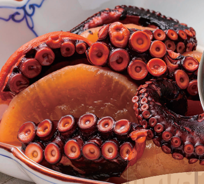
※写真は、イメージです。